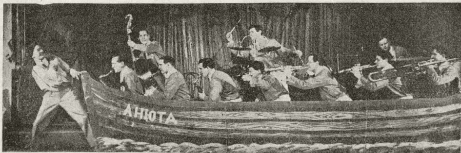
Теа-джаз Л. Утесова

Репертуар теа-джаза пока что далеко не удовлетворяет. В нем сохранилось многое не только от музыки, но и от текстов ресторанных „толстяков“. Общеизвестен анекдот об эстраднике, исполнившем чорт-знает-что под видом пародии. Когда Л. Утесов под аккомпанемент джаза поет слезливую „Кончитту“, то ироническое разрешение этой песни (преувеличенно прискорбный вздох) дела не решает в сущности. Пряная и расслабляющая эта песня производит свой эффект задолго до концовки. Совсем нелепое происходит с „Молотобойцами“. На весьма ресторанный мотивчик шибко-идеологическая „производственная“ песня о каких-то молотобойцах (текста, к счастью, не разобрать).